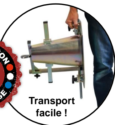
Transport facile !