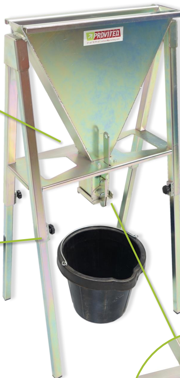
Statif avec pieds coulissants