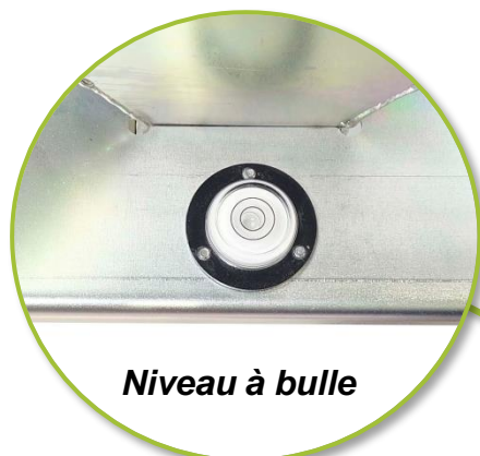
Niveau à bulle