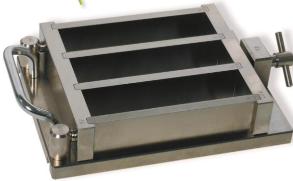
Réf. 20.0020 Moule triple