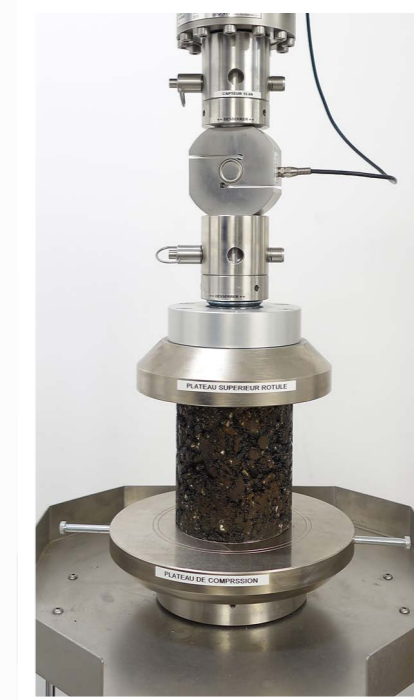
DISPOSITIF DE COMPRESSION