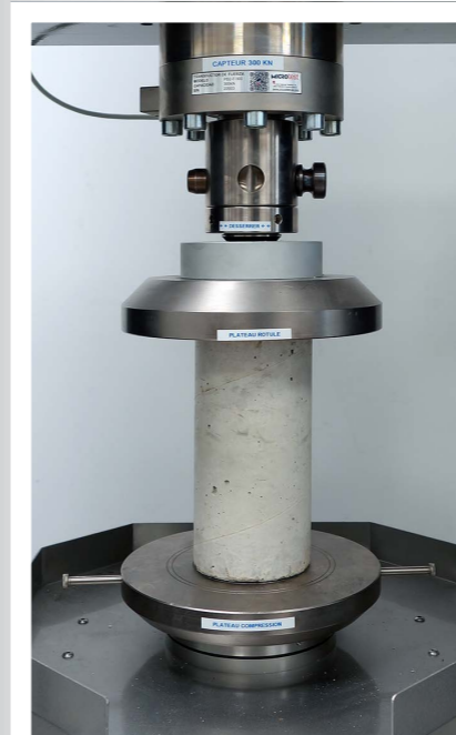
DISPOSITIF DE COMPRESSION