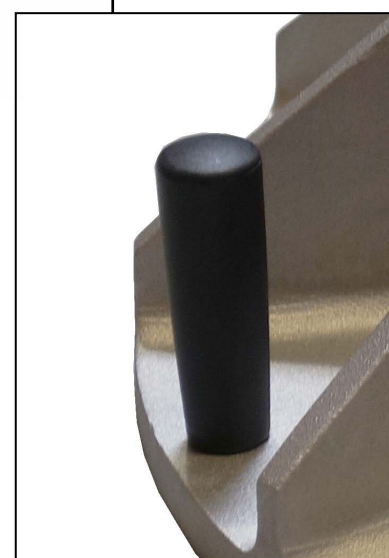
Poignée de levage