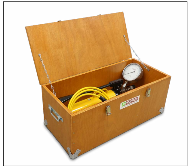
Caisse de transport